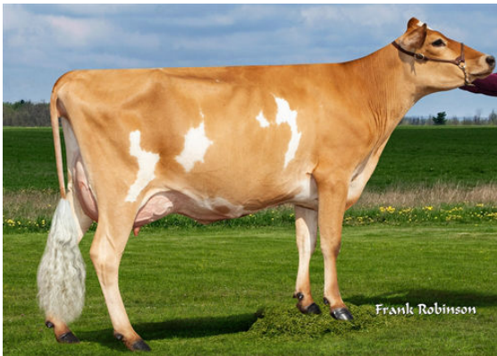
PROGENESIS CRAZE CORD {6} GRANDDAM